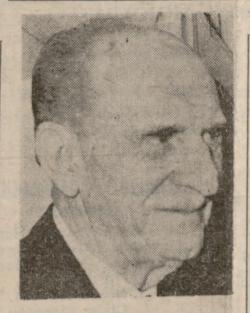
Ὁ δόκιμος ἐπὶ τῆς ἐπιτελείας τοῦ ἑθνικοῦ ἀποστολέου κ. Γεωργίου Παπανδρέου