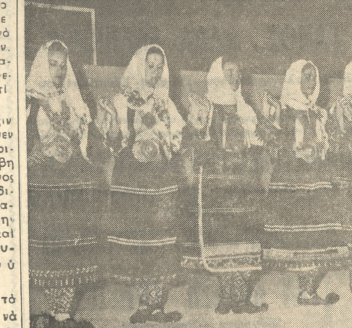
Κρητικοποῦλες τοῦ Λυκείου 'Ελληνίδων 'Ηρακλείου...