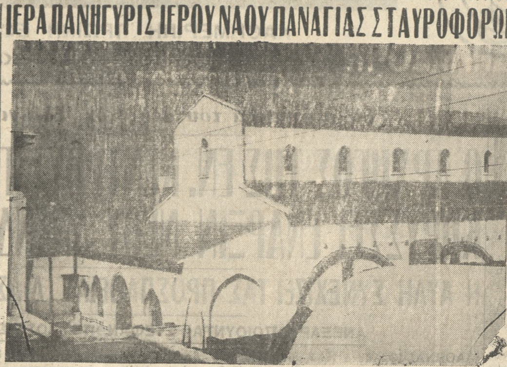
Φέρομεν εις γνώσιν τών εύσεβών χριστιανών ότι τήν 15ην Αύγουστού ε.ε. εορτάζει ό επί τής όδου Μάρκου Μουσουρού αναστηλωμένοσ 'Ιερόσ Ναόσ τής ΠΑΝΑΓΙΑΣ ΤΩΝ ΣΤΑΥΡΟΦΟΡΩΝ.

Τό Σάββατον 14ην Αύγουστού και ώραν 7 μ.μ. θέλει τελεσθή μέγασ έσπερινόσ, εν συνεχεία, ώρα 9ην μ.μ. Ιεράπαράκλησις ώσ και τό Μυστήριον τού 'Αγίου Εύχελίου. 'Ο ναόσ θα παραμείνη άνοικτόσ μέχρι τό μεσονύκτιον.