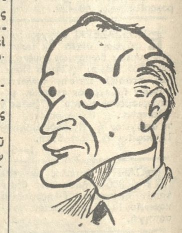
Ο κ. Π. ΚΑΝΕΛΛΟΠΟΥΛΟΣ