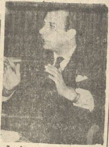
Ο υπουργός εξωτερικών κ. Σπύρος Κυπριανού...