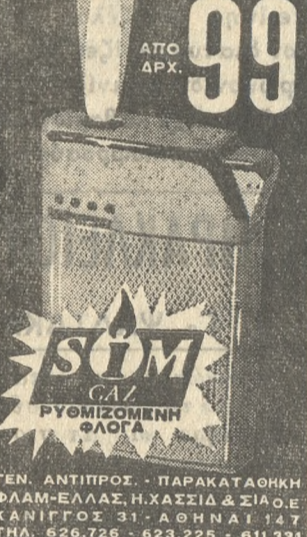
ΑΥΤΟΜΑΤΟΙ ΑΥΤΕΡΑΚΟΙ ΑΝΑΠΤΗΡΕΣ ΑΕΡΙΟΥ

Κι' είναι αυτός ο εαυτός μου τό φως του τό παίρνουν άλλοι γιατί βλαστήμιος την άπάτη και την άδικία. ΕΙΡΗΝΗ Π. ΒΛΑΧΑΚΗ