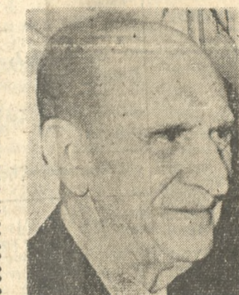
ΛΕ ΤΗΣ ΥΠΑΙΘΡΟΥ

Ο ΕΘΝΑΡΧΗΣ Γ. ΠΑΠΑΝΔΡΕΟΥ ΕΡΧΕΤΑΙ ΣΤΟ ΗΡΑΚΛΕΙΟ ΤΟ ΣΑΒΒΑΤΟ