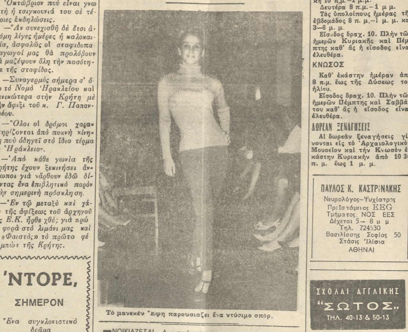
Τὸ μοντέκν "Εφη παρουσιάζει ἓνα ντύσιμο στοῦ.

ΑΠΟ ΤΗΝ ΕΠΙΔΕΙΞΗ ΜΟΔΑΣ ΣΤΟ 'ΞΕΝΙΑ, ΤΩΝ ΚΑΤΑΣΤΗΜΑΤΩΝ ΛΕΜΠΙΔΑΚΗ - ΖΑΦΕΙΡΟΠΟΥΛΟΣ