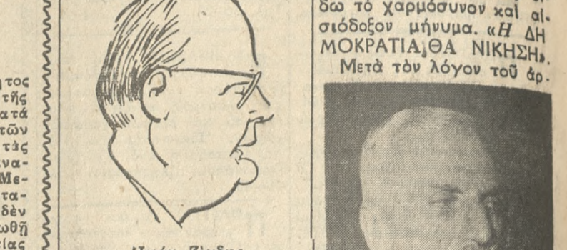
Ἰωάν. Ζιγδῆς τῆρηται τοῦ δημοκρατικοῦ πολιτεύματος καὶ δὲν δεχόμεθα καμμίαν παρέκλισιν καὶ εἰμαι σύμφωνος καὶ ἡ γνώμη τῆς ὁλοῦν ἀκολουθοῦμεν ὑπηρετεῖ ὅχι μόνον τὸ ἔθνος ἀλλὰ καὶ τὸν θρόνον. Ἐχθροὶ τοῦ θρόνου εἰναι οἱ κόλακες. Εἰναι οἱ Ἡρακλείς. Καὶ εἰπα ὁμιλῶν πρὸς τὸν λαόν τῶν Ἀθηνῶν αἱ ἐκλογαὶ δὲν γίνονται μόνον διὰ τὸν θρόνον, (φωτ. ἀ. ἐκλογαί) δὲν κινδυνεῖται ὁ θρόνος, οἱ Ἡρακλείς κινδυνεῖσιν.