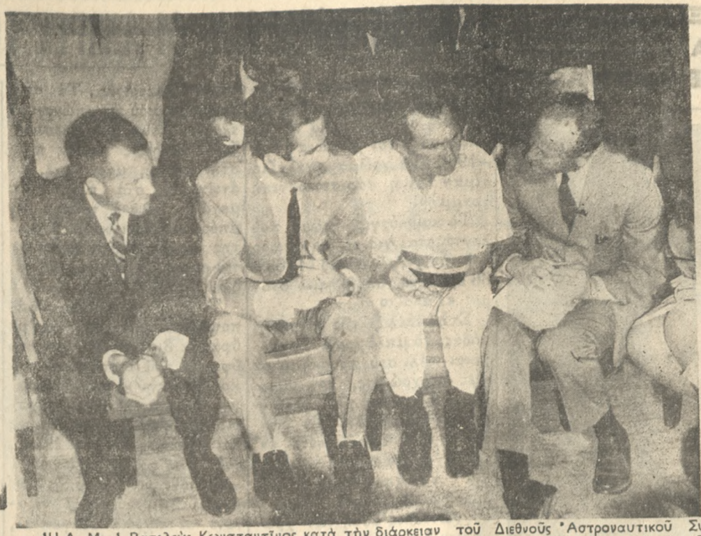
Η Α. Μ. ο Βασιλεύς Κωνσταντίνος κατά την διάρκεια του Διεθνούς Αστροναυτικού Συνεδρίου...