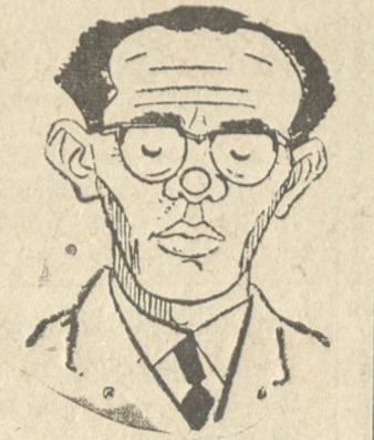
ΑΘ. ΚΑΝΕΛΛΟΠΟΥΛΟΣ εἰς παραίτησιν. Λοε τῆς Κρήτης, Λοε τῆς Ἑλλάδος ἐκτοτε μετὰ τὸ πραξικόπημα ἔχει τεθεῖ ἑνώπιον τοῦ ἑλληνικοῦ λαοῦ τὸ μέγα ἔρωτημα: εἰς τὴν Ἑλλάδα ποῖος κυβερνᾷ; ὁ βασιλεὺς; ἡ ἑλ. Λαός;. Καὶ εἰναι πάνδημος ἡ φωνὴ τοῦ λαοῦ.