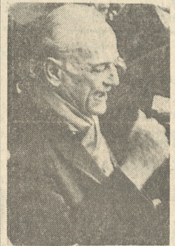
Π. ΚΑΝΕΛΛΟΠΟΥΛΟΣ Αρχηγός υπό επιτήρησιν

Ο κ. Γ. Παπανδρέου θα αναφερθή εις μέτρα και ενέργειαι της Κυβερνήσεως των άποστατών ή ο-