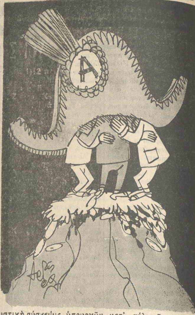
Μυστική σύσκεψις ύπουργών μετ' αύλικού «παράγοντος» στους Δελφούς!

Μεξύ τών έπαίτων πρέπει να γίνει διαχωρισμός αυτών που έχουν πραγματικώς άνάγκην, όποτε ύπευθύνος είναι ή πολιτεία, και τών πα