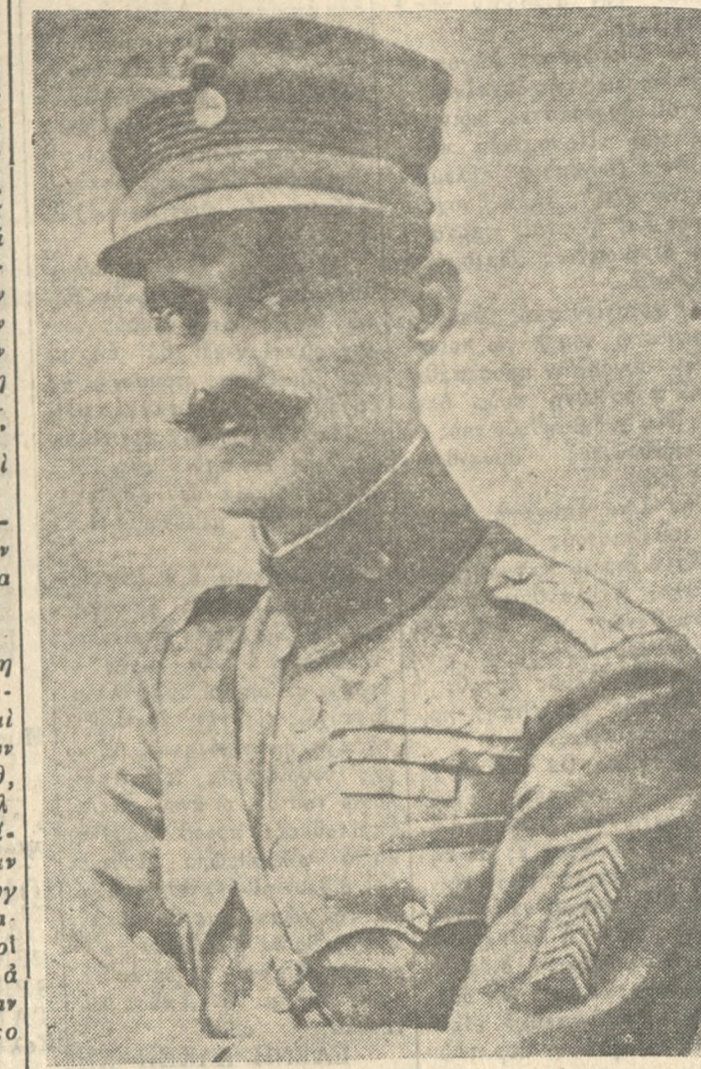
ΝΙΚΟΛΑΟΣ ΠΛΑΣΤΗΡΑΣ Ο θρυλικός Μάρτυρ Καβαλλάρης

ριόπου 2000 περί και 1.500 Τούρκοι Ιππείς, έκτος των 500 χωροφυλάκων. Η δύναμις αυτή ήταν ύπολογισμος και ύπερχεσνε τον συνταγματάρχη Ζαφειρίου να