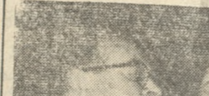
Δισπότην διά την επίσκεψιν του ο Κύπριος