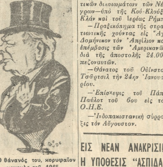
Ο θάνατος του κορυφαίου γεγονότος του 1965.