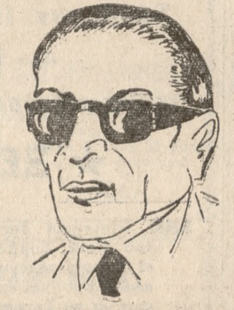
Εξήλθ κατά 3.700.000 στερελίων τό κεφάλαιόν τής και ήπειλήτε να έδνωσιν όποιήσιν αυτήν, έφ' όσον δέν θα συνειργάσεται εϊς τό φιλόδοξο σχέδιόν του δια τήν άνάπτυξιν του Μόντε Κάρλο.

ΑΘΗΝΑΙ 15.—'Ο πρίμην Ραινιέ τόν Μονακό και οι οικονομικοί σύμβουλοί του προπαθούν να συγκεντρώσουν άρκετά κεφάλια δια να εξαγοράσουν τάς μετοχάς τής 'Εταιρείας Θελασίων Λουτράων, τάς όποίας προσφέρει εϊς αυτόν ό 'Ελλην μεγαλοεφορμιστής κ. 'Αριστοτέλης 'Ωνάσης. 'Ο κ. 'Ωνάσης κατέχει τά 52 έκαστοτά του έτος έκατομύριον μετοχών τής εταιρείας. 'Εκατομύριον του πρίμην Ραινιέ ήρτήθη σήμερον να διακυβερνήσιν πολιν τινήν ζητεί ό κ. 'Ωνάσης δια τας 520.000 μετοχάς του εϊς τήν εταιρείαν, ή όποια είναι ίδιοκτήτρια του Καζίνο και τών σημαντικότερων ξενοδοχείων. Πιστεύεται ότι ή άξία τών μετοχών πλησιάζει τά τρία εκατομύρια στερελίων. Κατά τό παρελθόν φησινόφωρον, ό πρίμην Ραινιέ έξήτησεν από τήν εταιρείαν όπωσ αβ