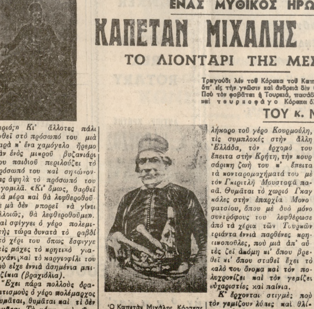
Ὁ Καρετάν Μιχάλης Κόρακας...