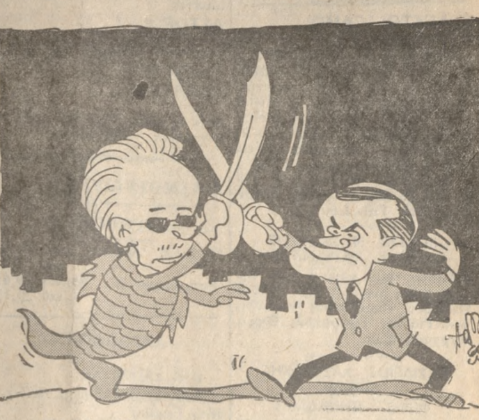
Οι δύο «Μονομάχοι»