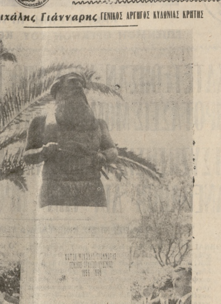
Ὁ ἀνδριὰς τοῦ Χατζὴ Μιχαὴλ Γιάνναρη ποὺ ἀπεκαλύφθη πρὸ ἡμερῶν στὰ Χανιά κατὰ τὴν ἐναρξὴ τοῦ Β'. Κρητολογικοῦ συνεδρίου, καὶ ἐπὶ τῆ ἑκατονταετηρίδῃ τῆς ἐπαναστάσεως τοῦ 1866, παρουσία τῶν συνέδρων.