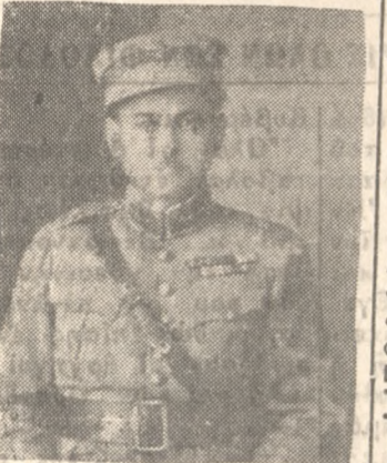
ΑΧΙΛΛΕΩΣ Ε. ΑΛΕΞΑΚΗ Στρατηγού...