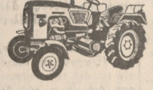
Δια περισσότερας πληροφορίας απευθυνθῆτε: Ε.ΝΑΤΗΣ & ΣΙΑ ΜΗΧΑΝΗΜΑΤΑ "Ὀδοποιίας - Λατομείων Δομικὰ Γεν. ἀντιπερσώπος Ε. ΛΟΥΚΑΚΗΣ Ἡράκλειον Τηλ. 37-76

ΟΛΟΙ ΟΙ ΑΓΟΡΑΣΤΑΙ ΨΥΓΕΙΟΥ Η' ΚΟΥΖΙΝΑΣ ΚΕΛVΙΝΑΤΟΡ ΑΠΟ ΤΟ ΚΑΤΑΣΤΗΜΑ ΑΦΩΝ ΜΕΣΣΑΡΙΤΑΚΗ ΚΑΤΕΧΑΚΗ 10 Τηλ. 56-68 ΑΠΟ ΣΗΜΕΡΟΝ ΜΕΧΡΙ 30 ΙΟΥΛΙΟΥ 1966 ΕΧΟΥΝ ΔΙΚΑΙΩΜΑ ΣΥΜΜΕΤΟΧΗΣ ΕΙΣ ΤΗΝ ΚΛΗΡΩΣΗ ΕΝΟΣ ΠΛΥΝΤΗΡΙΟΥ CASTOR RECOMAT ΑΓΟΡΑΣΤΕ ΣΗΜΕΡΑ ΤΟ ΨΥΓΕΙΟ Η ΤΗΝ ΚΟΥΖΙΝΑ ΣΑΣ ΚΕΛVΙΝΑΤΟΡ ΓΙΑ ΝΑ ΣΥΜΜΕΤΑΣΧΕΤΕ ΣΤΗΝ ΜΕΓΑΛΗ ΚΛΗΡΩΣΗ ΤΗΣ 31 ΙΟΥΛΙΟΥ 1966 ΠΟΥ ΘΑ ΓΙΝΗ ΕΙΣ ΤΟ ΚΑΤΑΣΤΗΜΑ ΑΦΩΝ ΜΕΣΣΑΡΙΤΑΚΗ ΚΑΤΕΧΑΚΗ 10 ΗΡΑΚΛΕΙΟΝ