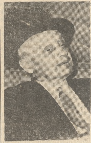
Ό κ. Π. Πιπινέλης σέως Έπιβεβαιούν εξ άλλου

ΑΘΗΝΑΙ 16.—Ό άνθρωπος των άνακτόρων, όπως άποκαλείται ό τ. Πρωθυπουργός και Βουλευτής της ΕΡΕ κ. Π. Πιπινέλης, άνέπτυξεν τās τελευταίας ημέρας έντονον πολιτικήν παρασκηνικήν δραστηριότητα. Δημοσιογραφικά πληροφοροφία, άναφέρουν ό κ. Πιπινέλης, είχε επαφάς με πολιτικές προσωπικότητες της συμπολιτεύσεως — τό σημερινόν κυβερνητικόν σχήμα θά παραμείνη ασφαλώς μέχρι τής επαναλήψεως των έργασιών της Βουλής. Αί μελλοντικές έσωτερικαι πολιτικαι εξελίξεις, και δ ή άν πράγματι θά επιβεβαιωθ ή με άπτάς εκδηλώσεις ό γενικός φίθυρος, ότι τήν άνοιξιν ή χώρα θά όδηγηθ εις έκλογάς, άναμένεται δέν ά γραφοφύν σαφέστερον και