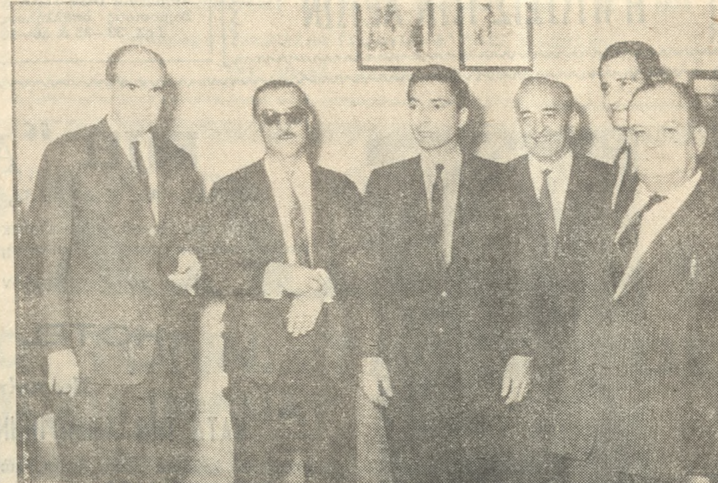
Οί κ.κ. Άνδρέας Παπανδρέου, Νικήτας Βενιζέλος, Κωννγος Κωνιντάκης φωτογραφούμενοι έντός του Φέρυ-Μπώτ «Μίνως».

Κοτέπλευσεν χθές εις τόν λιμένα μας μέ τουριστάς διαφόρων έθνικότητων τό «Ρομάντικα» μέ 85. Άεροπορικός άφίχθησαν