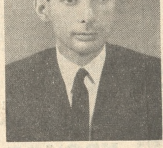
Κληνικός Λαός εις τό προσκλητήριο τής 'Ενώσεως του Κέντρου σε μία θετική προσπάθεια εφαρμογής τής πολιτικής και κοινωνικής Δημοκρατίας και δεν έδίστασε να άποδεχθή τόν ρόλον του πρωταγωνιστού τής άνομιλίας.

'Η αντίδρασις τής δεξιής έθουρηβή από τήν ανταπόκρισιν που έπέδειξεν ο 'Ελ-