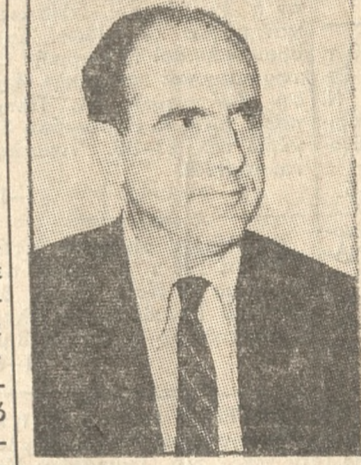
Είχε ο νεαρός Βασιλεύς τήν καλή τύχη, να άνέλθη στον θρόνον όταν κυβερνήτης τής χώρας ήταν ο Γεώρ. Παπανδρέου, ο άρχηγός τής μεγάλης δημοκρατικής παρατάξεως. Είχε τήν ευκαιρία να συνδεθί με τήν μεγάλη μάχη του ελληνικού λαού. Είχε τήν ευκαιρία να ακολουθήσει τά φωτεινά παραδείγματα των Βασιλέων των Σκανδιναβικών χωρών. Είχε τήν ευκαιρία να βασιλεύη χωρίς να κυβερνά.

Κρής, ο μεγάλος 'Ελληνας, ο 'Ελευθέριος Βενιζέλος. Στη μνήμη του ύποκλινομάσσε με κατόνυξη. Στην Κρήτη στον ίερο αυτό χώρο τής λεβεντιάς και τής αυτοθυσίας υπογράφουμε συμβόλαια τιμής πώς θα συνεχίσουμε τό έργο του. Πώς θα