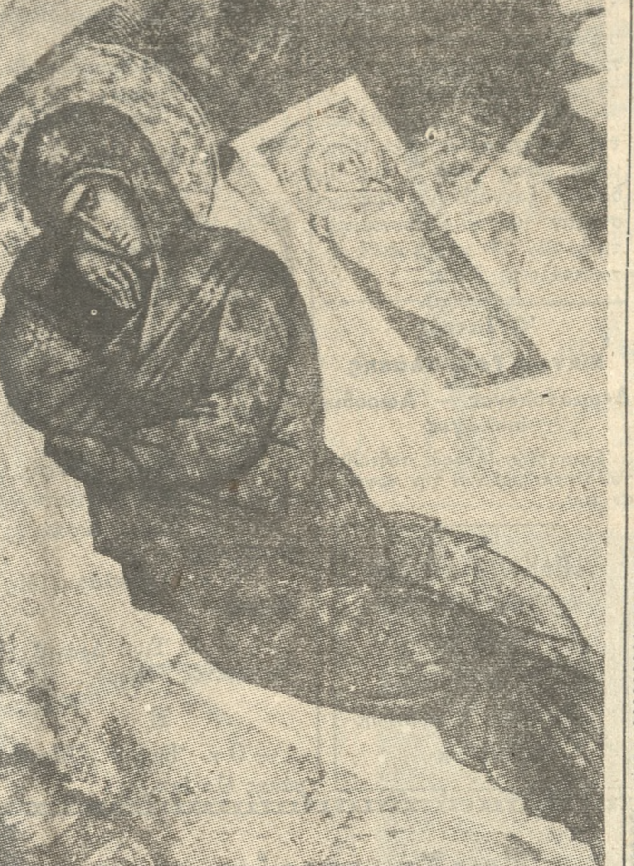
Στὴν ἀπέριτη φάτνη τῆς Βηθλεέμ, ποὺ συμβολίζει τὸ ὑψηλὸν ἰδεώδες τῆς εἰρήνης, στρέφεται σήμερον ἡ Παγκόσμιος προσοχή.

Ἡ «ΠΑΤΡΙΣ», Εὐχεται εἰς τοὺς ἀναγνώστας τῆς ΚΑΛΑ ΧΡΙΣΤΟΥΓΕΝΝΑ