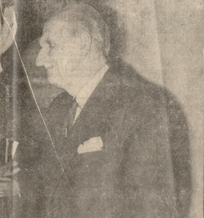
Ο άρχηγός της Ένωσεως Κέντρου κ. Γ. Παπανδρέου.

μάλης λειτουργίας του ισχύον- τος πολιτεματος της Βασιλευ- ομένης Δημοκρατίας. Και εις μένομεν εις αύτήν τήν άρχήν. Έχουμε διακηρύξει ότι δέν, πρόκειται νά σχηματισώμεν λαϊκόν μέτωπον. Και τρησώ- μεν τον λόγον μας. Εμμεθα ιδεολογικώς αυτονομία και πολιτικώς αυτοδύναμοι. Θα εμμεθα άντιμετώπι και της