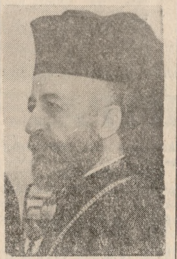
ΜΑΚΑΡΙΟΣ Ἐκλήθη νὰ συμμετάσχη

ΑΘΗΝΑΙ 3. — Ὁ πρῶτος ὑπουργὸς κ. Παρασκευῶς