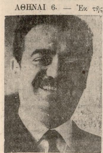
Ε.Κ. άνεκρόθηθι ότι κατό πιν έντολής του άρχηγού

ΑΘΗΝΑΙ 6. — Έκ της του κόμματός κ. Γ. Παπανδρέου επεσκέφθη την μεσημέριαν τόν πρωθυπουργόν κ. Παρασκευάσπουλον ό βουλευτή της Ρεθύμνης κ. Βαρδινογιάννη και εξήγησαν την άμεσον παρέμβασιν του διά την λήψιν επεμεινόντων μέτρων πρὸς αντιμετώπισιν των ζήτηματων όσων ύπέστησαν οι παραγωγοί εσπεριδοειδών Κρήτης λόγω του παγετού. Ο κ. Βαρδινογιάννης εξήγησεν επίσης παρέμβασιν του κ. πρωθυπουργού διά την αντιμετώπισιν διαφόρων της βρεγμένης σταφίδας.