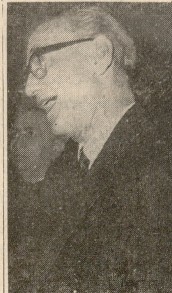
Ό τέταρτος Αλλικός Πρωθυπουργός

πιάς: «Τό ένεχόμενον παρο- χής έντολής εις τήν ΕΡΕ, ή όποία είναι δεύτερον κόμμα, θα άπετέλη θαυμάσιον σκάν- δαλον. ΘΑ ΑΠΕΤΕΛΗ ΚΑΙ ΥΠΟΤΡΟΠΗΝ ΤΟΥ ΠΡΑΞΙΚΟΠΗ Μ Α Τ Ο Σ ΤΗΣ 15ΗΣ ΙΟΥΛΙΟΥ. Τέ- τε έπεχειρήθη ή διάσπασις τής Ε.Κ., διά τής μεθόδου πρωθυπουργοποιήσεως και ύπουργοποιήσεως μελών της. Τώρα άποψ έξηγηθήθη αυτή ή προσπάθεια, θα ένι- σχύετο άπροκαλύπτως τού ά- τίταλον κόμμα ή ΕΡΕ. Με τοιαύτην ένέργειαν ό βασι- λεύς θα έγένετο κομματάρ- χος. Και θα αναλάμβανε τās