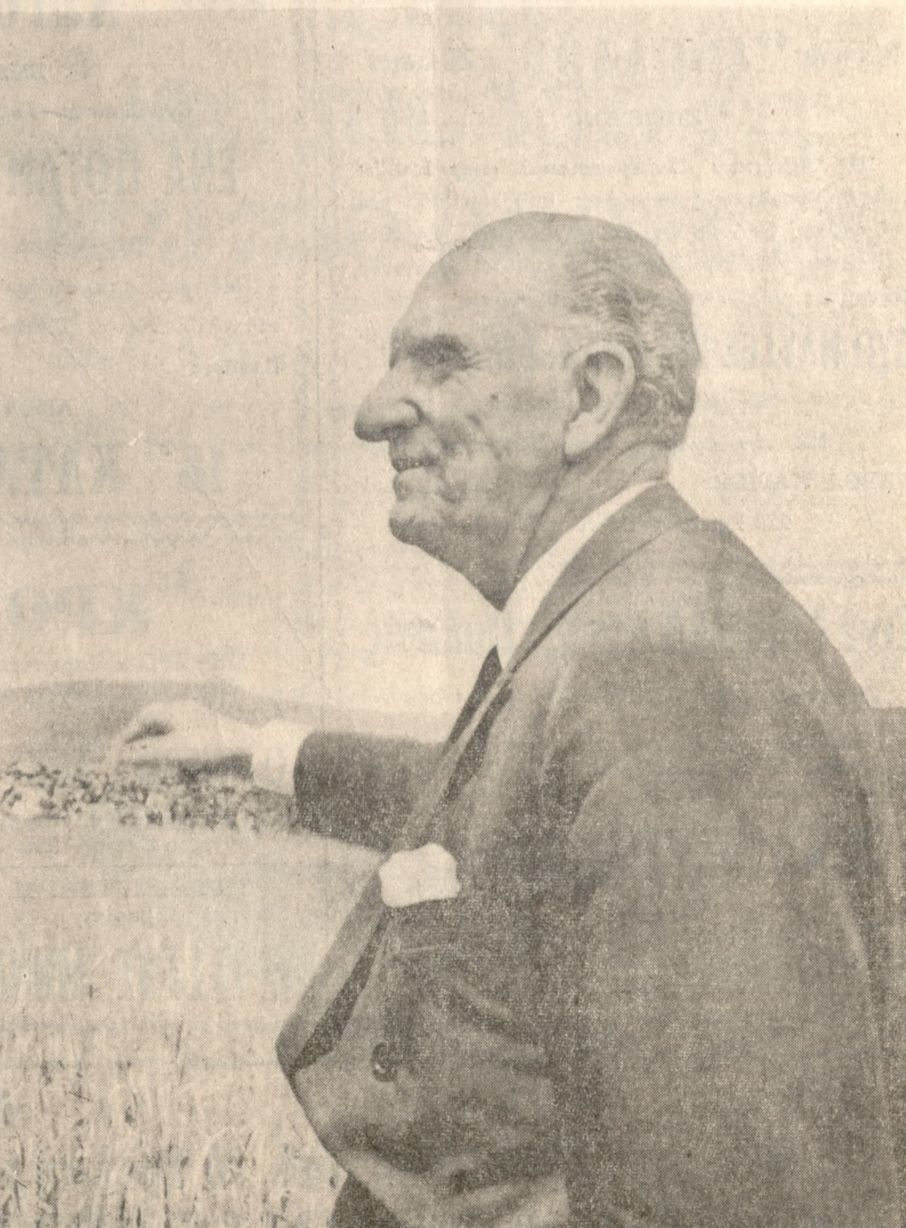
Ο ΕΘΝΑΡΧΗΣ Γ. ΠΑΠΑΝΔΡΕΟΥ «Ό Βασιλεύς κατέστη κομματάρχης»