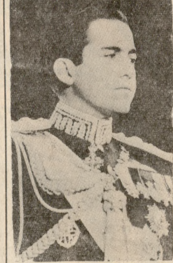
«Έδωσεν άντίθετον λύ- σιν προς τήν έπιθυμίαν τού λαού

Τά γεγονότα τής χθεσί- νης ήμέρας έχουν ως εξής: Τήν μεσημέριαν άνήλθεν εις τά άνάκτορα ό κ. Παπα-