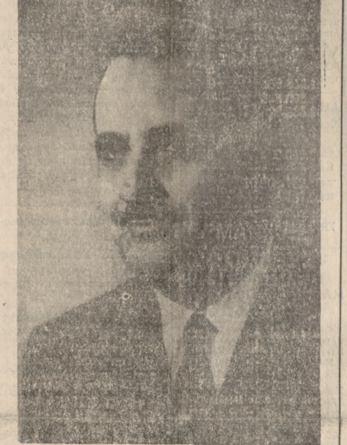
Ο ΔΙΟΙΚΗΤΗΣ ΤΟΥ ΙΚΑ Κ. ΝΙΚΟΛΑΟΣ Δ. ΔΕΛΗΠΕΤΡΟΣ

κατοίκων περί των ειδών τά όποια πρόκειται να σταλούν διά την Παγκρητίον Έκθεση Λαϊκής Τέχνης. Έπίσης όρισαν Έπιτροπήν σε κάθε χωρίο άποστελούμένη άπό την Έρέρα τον Πρόεδ. Κοινότη. και τον διδάσκαλον έπως φροντίσουν διά την συλλογήν των έκθεμάτων.