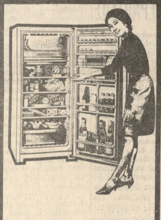
Ἡ στιγμιαία αὐτομάτος ἀπόψυξις, σὰς ἀπαλλάσσει ἀπὸ τῆς φροντίδας. Ἐύκολα καὶ γρήγορα, χωρὶς νὰ μετακινήσετε τὸ περιεχόμενο τοῦ ψυγείου ἐπιτυχᾶνετε πλήρη ἀπόψυξι, σὲ ἓνα μόνο λεπτό. Τὰ πρόφραμα σὰς μένου ἀνέπαφα, ἀκόμα καὶ τὸ παγωτό δὲν προφταίνει νὰ λυῖσθ.