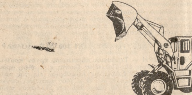
SL 1500 1,53 - 3 κυβ. μ.

Όχι με λόγια αλλά με ιστορία 42 συνεχών έτών τά άγγλικά εργοστάσια CHASESIDE