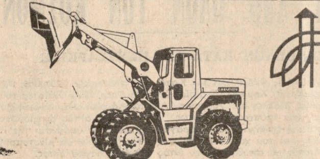
SL 1000 1,15 - 2,29 κυβ. μ.