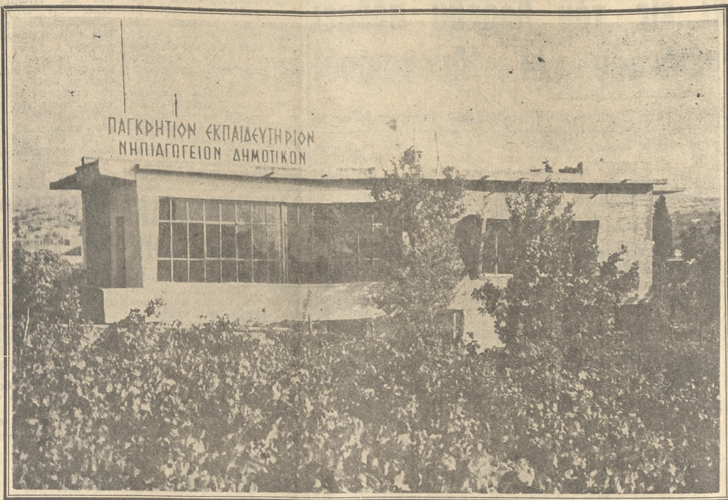
↑ ΝΗΠΙΑΓΩΓΕΙΟΝ - ΔΗΜΟΤΙΚΟΝ