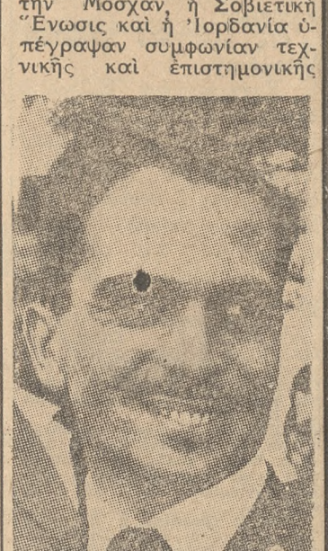
Ο ΒΑΣΙΛΕΥΣ ΧΟΥΣΕΪΝ ΣΥΝΕΡΓΑΣΙΑΣ. Σήμερον, ο βασιλεύς Χουσεΐν άναγορεύει εκείθεν, επιστρέφον εις τήν χώραν του. Ούδέν ενώνσθη περί παραφοράς και άποδοχής παραφοράς ρωσικής στρατιωτικής βοήθειάς προς τήν Ιορδανίαν.

ΑΘΗΝΑΙ 5. — Χθές εις τήν Μόσχαν, ή Σοβιετική Ένωσις και ή Ιορδανία υπέγραψαν συμφωνίαν τεχνικής και επιστημονικής συνεργασίας. Έν τούτοις, ο βασιλεύς Χουσεΐν έπεβώρησε, χθές, ρωσικήν άεροπορικήν βάση πλίσιον της Μόσχας, όπου παρηκολούθησεν απογειώσεαι και προσγειώσεαι ρωσικών πολεμικών άεροπλάνων. Έν συνεχεία ούτως επεβώρησεν, εις άλλας βάσεις, τεθωρακισμένα όχηματα και βαρεία πυροβόλα. Τήν νύκτα, εις συνέτευξιν του προς τούς δημοσιογράφους, ο νεαρός Ιορδανός βασιλεύς δέν ήθέλησε ν' άπαντησιν εις τήν ερώτησιν άν διεπραγματεύθη τήν άγερσιν ρωσικών πολεμικών ούλων, ειπών: «Ούδέν έχω νά ειπω, πωσών στήν αήτην. Θα είπω, όμως, πολλά άφύγροτον...»