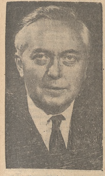
Ο κ. ΟΥΓ'ΑΣΟΝ σματος έγκριθέντος διά ψήφων 2.752.000 έναντι 2.632.000 τώ δέον συνέδριον του Έργων του Κόμματος, έκλεισε την κυβερνήσαν Ούλσον όπως άπογορευτική πλήρως τας εθνικές πολιτικές της άμερικανικής πολιτικής εις τώ Βιετνάμ, ήλιωσε τόν κάμεσον, όριστικόν...

ΑΘΗΝΑΙ 5. — Το Έργον των Κόμματος άγνοήσαν τας έπειτασας έκκλησεις της κυβερνήσεως Ούλσον, κατέδικασε την άμερικανικήν πολιτική επί του βιετναμικού και τούς βομβαρδισμούς έναντιον του Βορείου Βιετνάμ. Διά ψηφισ...