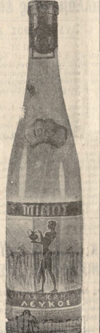
ΛΕΥΚΟΣ ΞΗΡΟΣ ΜΙΝΩΣ. Ἀπαλὸ, εὐγευστό, ἐλαφρὸ, λεπτὸ κρασί.

ΑΠΟΨΕ ΣΤΟΝ ΚΡΟΝΟ. Μία ἱστορία ΓΙ-ΓΑΝΤΩΝ πού θὰ σᾶς καθλιώσῃ ἀκίνητους ἐπὶ 2 συνεχεῖς ὥρες.