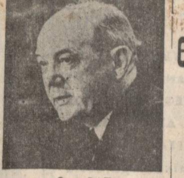
Ο Κ. ΡΑΣΚ

μελών τού ΣΕΑΤΟ ο κ. Ράσκ έτόνωσεν ότι τό ΆνοΪ σπηρεύεται κυρίως εις τήν διάτρεσιν τού έλευθέρου κό σμου και τάς έπισταμένως μεταξεί των συμάχων δια φονίας και προσέθεσεν, ότι έν πάση περιπτώσει πρό πει να παισθούν οι κομμουνισται ότι δέν είναι δυνα τόν να σημειώσων άποφασιστικήν νίκην εις τά πε διά των μαχών. σε την Βρετανίαν και την Σοβιετική Ένωσιν να κά μουν καλήν χρήσιν της θέ σεως των ως συμπερόδρων τις συμφωνίας της Γενεύης διά την ειρηνικήν επίλυσιν τού Βιετναμικού προβλήμα τος. Ο ραδιοσταθμός της Μό σχας ίσχυρίσθη ότι Άμερι κανικά άεροπλάνα εξετέλε σαν νέας έπιδρώμας έναντί ον τού βορείου Βιετνάμ πολ λάς ώρες, μετά την από τού προέδρου Τζόνσον έξαγγελία αν περί μερικής διακοπής των βομβαρδισμών. Οι παρατηρηται προσέθε σεν ο ραδιοσταθμός της Μόσχας θεωρούν τήν τέλευ ταίαν Άμερικανικήν ένέρ γειαν ως μία, ακόμη ύπο κριτικήν πράξιν. Μεταδίδεται από την Σα γκρόν ότι οι Βιετικόν έπιλη ξαν την πρωίαν με άλμους και ρουκέτας δύο σημαν κούς στόχους εις τήν περι οχή της προαεσίσεως τού νο τίου Βιετνάμ. Έξ άλλου σφοδρόταται μέχρι έπισημώθησων χθές περί της Σαγκρον κατά τάς όποιαις οι κομμουνισται ύπέ σταν βαρυντάτας άπωλει