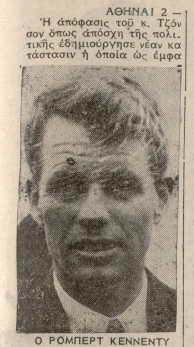
Ο ΡΟΜΠΕΡΤ ΚΕΝΝΕΝΤΥ βίτσει σήμερα διανοίγει την δδόν προς την Προεδρί αν δια τον κ. Ρομπερτ Κέν νεντυ. Καί τούτο διότι ο σπουδαιότερος αντίπαλος του εγκατέλειπε τόν αγώνα