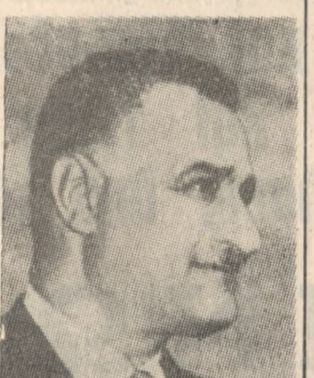
ΓΚΑΜΑΛ ΑΜΙΝΤ ΕΛ ΝΑΣΕΡ