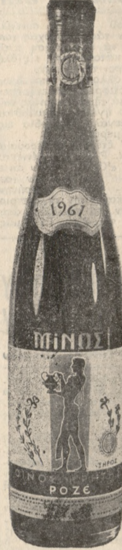
ΡΟΖΕ ΞΗΡΟΣ "ΜΙΝΩΣ," Αρωματικό, βελούδινο, ρομπινί, με ἰδιότυπα και μοναδικά χαρακτηριστικά, επιτραπέζιο κρασί.

ΧΑΡΙΑΝΘΟΣ ΠΑΠΑΧΑΤΖΑΚΗΣ 'Ιατρός Ειδικός Παθολόγος Δέχεται εις τό Ιατρείον τού οδός Καγιαμπή-Γραμβούσης δίπλοσθεν εμποροραφείου Βαμβουκάκη. 'Όροι επισκέψεων 8-9 π.μ. 4-7 μ.μ. Τηλέφ. 80.975