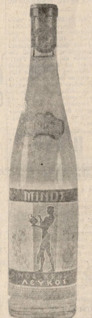
ΛΕΥΚΟΣ ΕΗΡΟΣ ΜΙΝΩΣ, Ἀπαλὸ, εὐγευστὸ, ἑλαφρὸ, λεπτὸ κρασί.

Εγχερωμὸν Σινεμασκὸπ Συμπρωταγωνιστοῦ: ΤΟΝΥ ΦΡΑΝΤΣΙΟΖΑ - ΡΟΝΑΛΝΤ ΦΡΕΪΖΕΡ - ΤΟΜ ΑΝΤΑΜΣ.