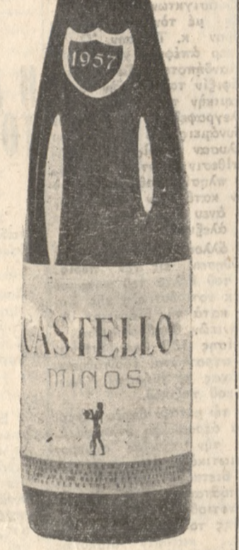
CASTELLO "ΜΙΝΩΣ" Ειδικής οινοποίησης θαθύ

Ν. ΒΑΣΙΛΑΚΗ Τηλ. 4686 Γνωστοποιεί εις την αξιότιμον πελατείαν