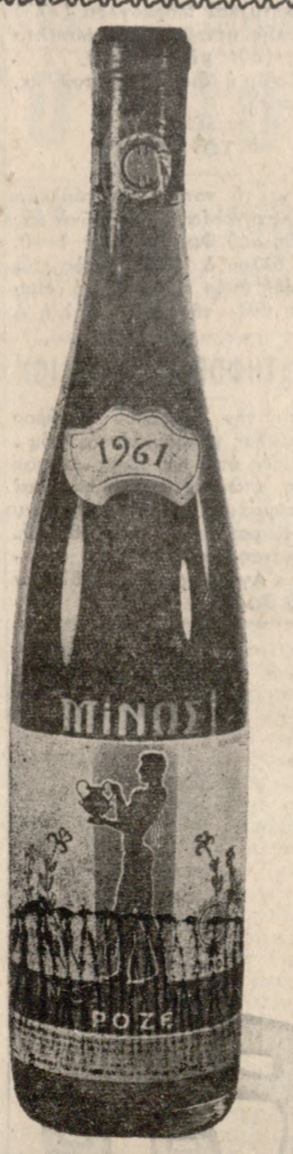
ΡΟΖΕ ΞΗΡΟΣ "ΜΙΝΟΣ" Αρωματικό, δελουδινο, ρομπινί, με ιδιόαυτα και μοναδικό χαρακτήρα, έπιτραπέσιο κρασί.

Διάρκεια ταξιδίου μας 10 ώρες ΓΚΑΡΑΖ ΔΙΑ 70 ΕΠΙΒΑΤΗΓΑ ΑΥΤΟΚΙΝΗΤΑ ΚΕΝΤΡΙΚΟΝ ΠΡΑΚΤΟΡΕΙΟΝ ΗΡΑΚΛΕΙΟΥ Τηλέφωνα 27-30 43-60