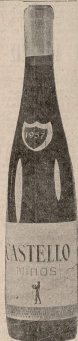
CASTELLO "ΜΙΝΩΣ" Ειδικήσ οίνοποιήσεως θαδ)χρον κόνκινο παλιό ζηρό κρασί με άξιώσεις άναγνωρισεως του ως άσυναγωνιστου.