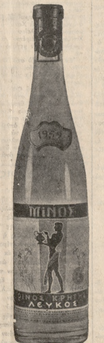
ΛΕΥΚΟΣ ΞΗΡΟΣ ΜΙΝΟΣ, Ἄπαλό, εὐγευστο, ἐλαφρὸ, λευκὸ κρασί.

ΖΗΤΕΙΤΑΙ μικρὴ 14-18 ἐτῶν δι- ἀνδρόνυμο μὲ ἕνα παιδάκι. Κατὰ τὰς ἀπογευματινὰς ὥρας ἰσχυρῶς νὰ παρακολουθῆ μαθήματα ραπτε- κῆς ἢ κομμωτικῆς. Πληρ. τηλ. 37,57. 1-15