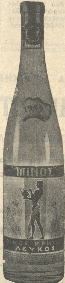
ΛΕΥΚΟΣ ΞΗΡΟΣ ΜΙΝΟΣ, Ἄπαλό, εὐγευστο, ἐλαφρὸ, λευκὸ κρασί.