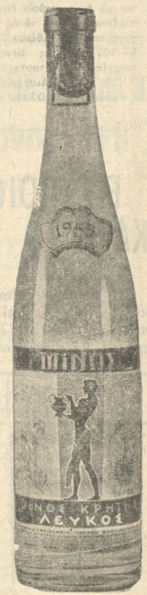
ΛΕΥΚΟΣ ΞΗΡΟΣ ΜΙΝΩΣ, Άπαλό, εγγυστο, ελαφρό, λευκό κρασί.

Κεντρικά πρακτ. 25ης Αύγ. Έναντι Άγ. Τίτου Τηλ. 64.50 και 65.50 " " Έβανς " 37.77 " 63.88 " " 25ης Αύγ. Μ. Θεοδωσάκη Ξ 27.06 Χανίων Πόρτα Μανουράς τηλ. 2646