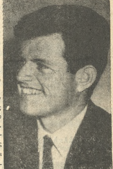
Ο κ. ENT. KENNEDY

νομένων Πολιτειῶν κ. Χάμφρευ εὐχαρίστησε ὅτι ἐὰν ἐκλεγθῆ Πρόεδρος θὰ ἦτο διατεθειμένος νὰ διακινή τοὺς βομβαρδισμοὺς ἐναντίον τοῦ βορείου Βιετνάμ ὑπὸ τὸν ὄρον ὅτι οἱ κομμουνιστὰὶ θὰ ἐπέδεικνουν διαθέσιν ἀποκαταστάσεως τῆς ἀποστρατιωτικοποιήσεως τῆς Ζώνης ὁποῖα χωρίζει τὸ Νότιον ἀπὸ τὸ Βόρειον Βιετνάμ. Θὰ ἦσαν διατεθειμένους νὰ σταματήσω τοὺς βομβαρδισμοὺς προσέθεσεν διότι τοῦ θὰ ἦδύνατο νὰ ὀδηγήσῃ εἰς ἐπιτυχίαν τῶν εἰρηνευτικῶν διαπραγματεύσεων καὶ συντάξασιν τοῦ πολέμου. Ἐὰν ἡ κυβέρνησις τοῦ Β. Βιετνάμ δεῖξῃ κακὴν πίστιν θὰ ἐπιφυλάχῃ νὰ ἀποφασίσῃ τὴν ἐπαύλῃσιν τῶν βομβαρδισμῶν. Ὁ κ. Χάμφρευ εὐχαρίστησε ἀκολούθως ὅτι θὰ προτείνῃ ἄμεσον κατάτασιν τοῦ πυρὸς