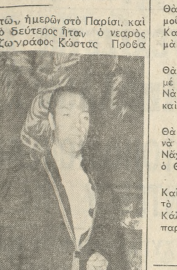
Τά έπιδειξε έσπασε τήν καθιερωμένη ρουτίνα τής άνδρικής ένδύσεως στη χώρα μας.

Σημειωτέον ότι ή χειμερινή κόλλεξιόν του Βασιλάη Κουναλάκη παρουσιάσθηκε από δύο κομψούς άνδρες.