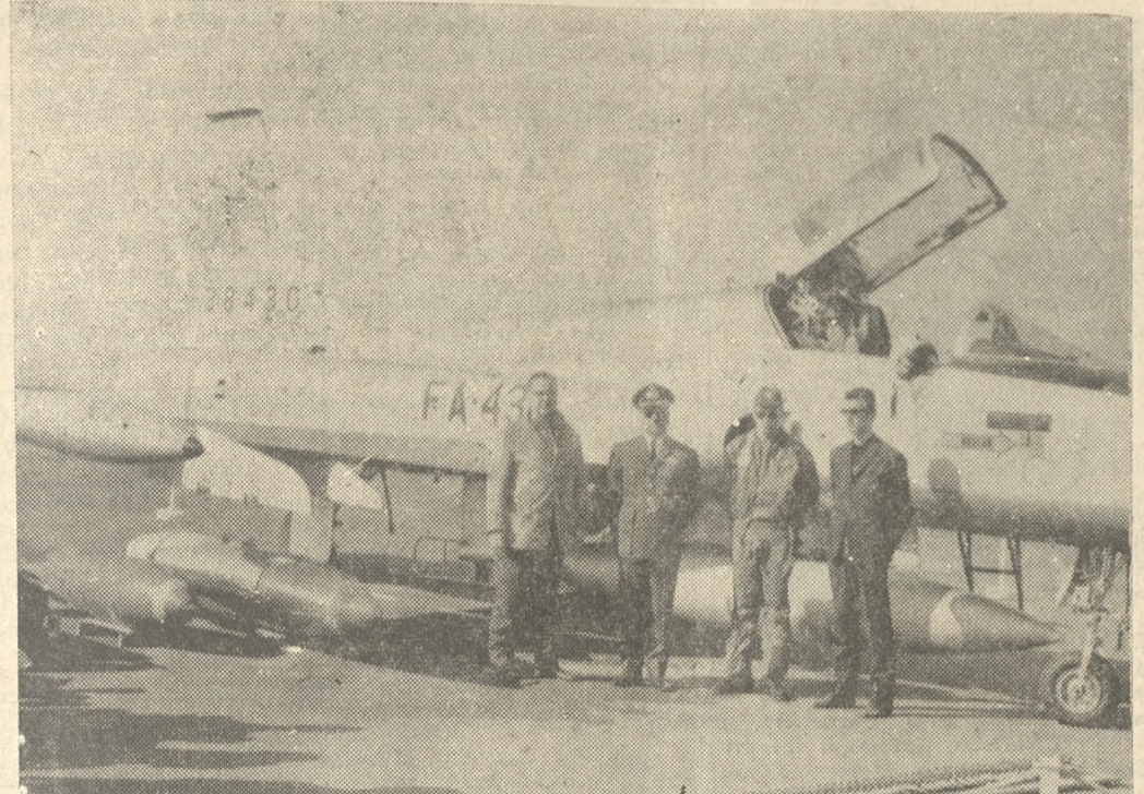
Ὁ Διοικητῆς τῆς 126ης Αεροπορικῆς Βάσεως Ἡρακλείου Ἐπισημηγῶς κ. Ἀλέξ. Ζαρωφιντῆς, ὁ πῦλος τοῦ εἰκονιζομένου ἀεροπλάνου Γ5, ὁ Διευθυντῆς μας καὶ ὁ συντάκτης τῆς ΠΑΤΡΙΔΟΣ κ. Σώτος Παϊδάκης

δος. Έκ παραλλήλου ἦνοι ζεν από χθές εντός τῆς Μονάδος εκθεσεις αεροπορικῶ περιεχομένου ὡς και τοιαῦτα φωτογραφίας. Εις τας ἐνλόγῳ εκθέ