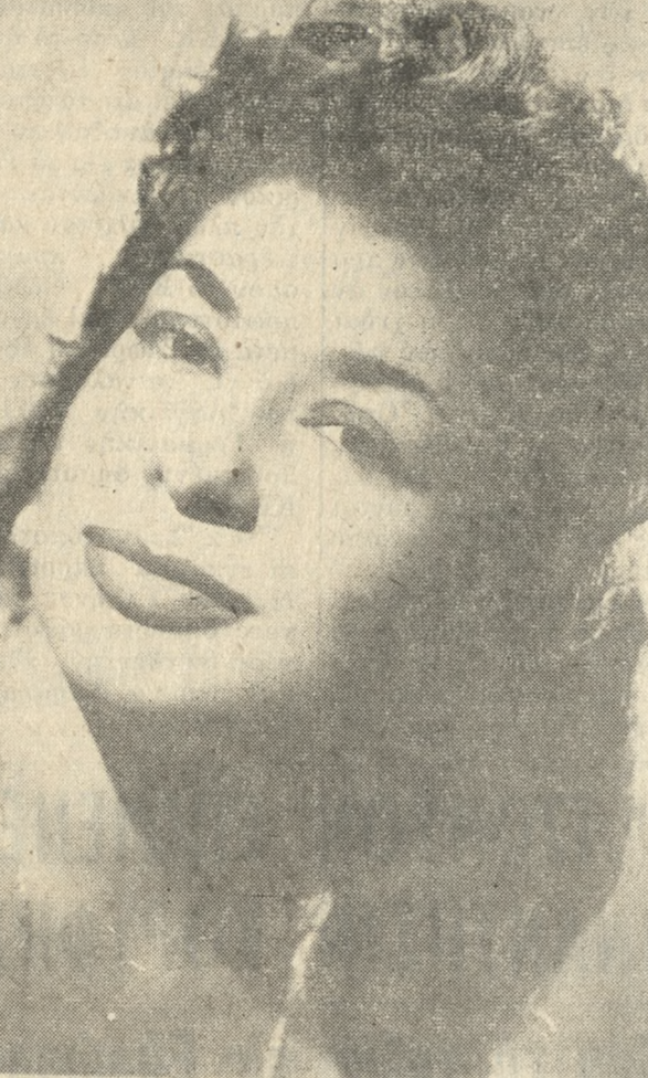
Ἡ μπριόζα ντυζέξ μετὰ τὴν βελουδίην φωνήν πού κάθε βράδυ στὰ Μπαγκαλόους ΦΟΥΝΤΟΥΛΛΑΚΗ σκορπάζει τὸ κέφι.