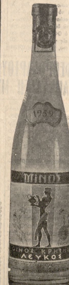
ΛΕΥΚΟΣ ΣΗΡΟΣ 'ΜΙΝΩΣ, 'Απαλό, άγνεστο, έλαφρό, λευκό κρασί.

ΑΝΤΙΠΡΟΣΩΠΟΣ ΗΡΑΚΛΕΙΟΥ - ΛΑΣΙΘΙΟΥ ΔΗΜΗΤΡΟΣ ΚΩΝ)ΝΟΥ ΓΙΟΜΕΛΟΣ Ν. Πλαστήρα - Πλατεία Κύπρου Τηλ. 48-16 και 81-830 ΗΡΑΚΛΕΙΟΝ ΚΡΗΤΗΣ