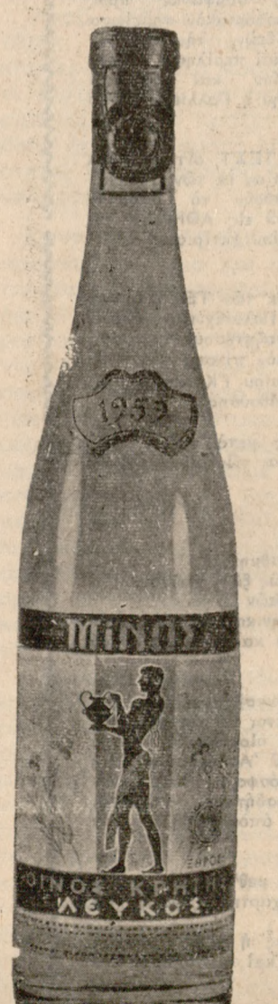
ΛΕΥΚΟΣ ΕΦΡΟΣ ΜΙΝΩΣ, Άπαλό, εφρυστο, ελαφρῆ, λευκό κρασί.

ΜΗΧΑΝΟΥΡΓΙΚΑ ΜΗΧΑΝΗΜΑΤΑ STANKOIMPORT... ΜΗΧΑΝΟΥΡΓΙΚΑ ΜΗΧΑΝΗΜΑΤΑ άκριβείας, ισχυρά κατασκευή και μεγάλες άποδόσεις.