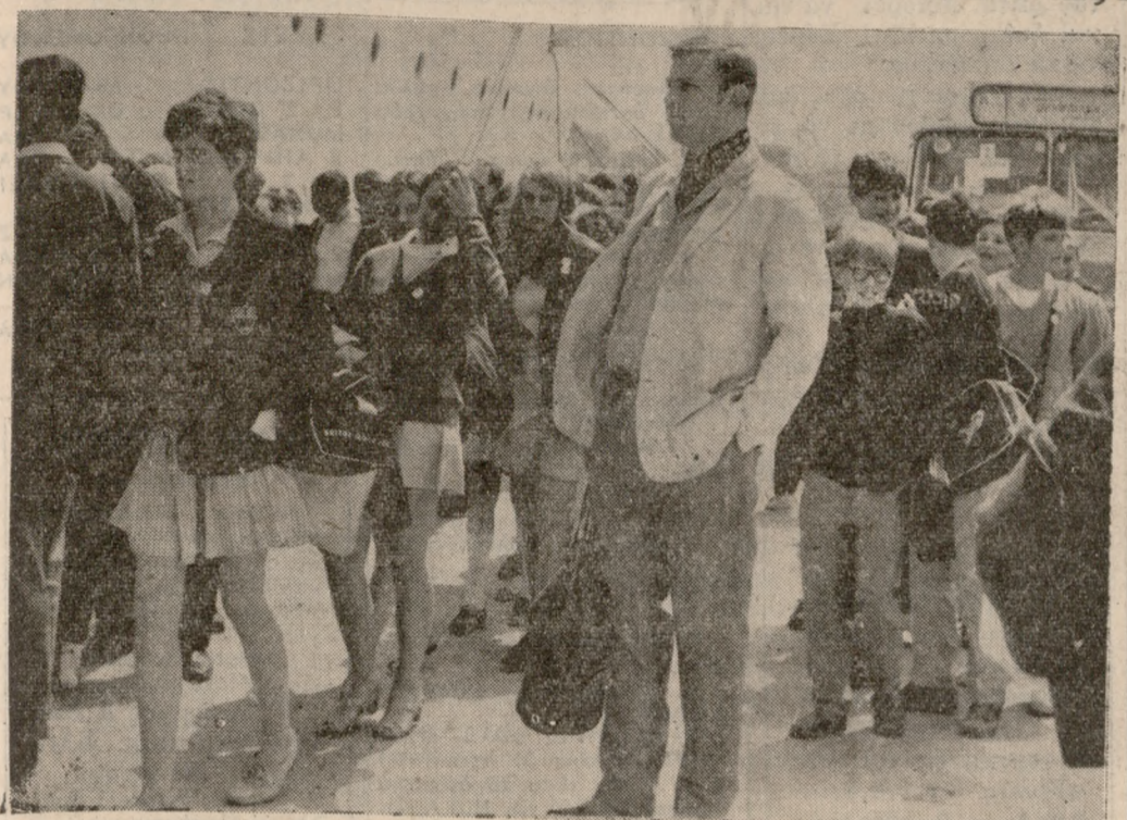
Κατέπευσε χθές εις τόν λιμένα μας τόν υπερωκεάνειον-Σχολειόν «ΝΕΒΑΣΙΑ» επί του οποίου επέβαιναν 1300 μαθηταί και μαθήτριά του Αγγλικών Κολεγίων.