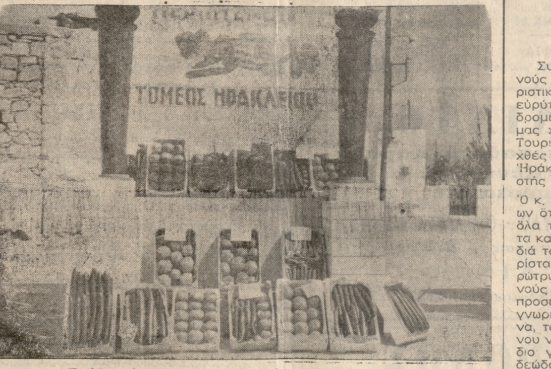
Πρῶμα ὀπωροκηπευτικὰ ἐκλεκτῆς ποιότητος.

μῆνο ἔτος. Καὶ τὸ εἰσὸδημα πού ἔδωσαν ἦταν καταπληκτικὰ ἀνώτερον, ἀσύγκριτον ἐν ὁμοίᾳ μετὰ τὸ μέχρι τότε στρεμματικὸ εἰσὸδημα τῶν ἄλλων καλλιεργειῶν. Αὐτὴ ἡ διαπίστωσις ἦταν ἀρκετὴ. Ἡ πρώτη ἐπιτύχη ἦταν ἡ ἀνάσχεσις τοῦ ρεῦματος φυγῆς πού χαρακτηρίζετῃ τῆς Ἑλληνικῆς ὑπαίθρου. Καὶ ἄρτι χῆμα συστηματικὴ ἡ προσπάθεια, ἐπεκταστικὴ τῆς καλλιεργίας καὶ ἀξιοποιήσεως τῶν δυνατοτήτων τοῦ τόπου. Σὴν ἡμερᾶ, μόνον στὸ Τυμπάκι καὶ λειοργατοῖν 2000 στρέμματα ἀπορωροκηπευτικῶν στὸ ὑπαίθρου καὶ σὲ θερμότητα δειγμάτων τῶν ὁποίων ἦσαν τὰ ἐκθέματα