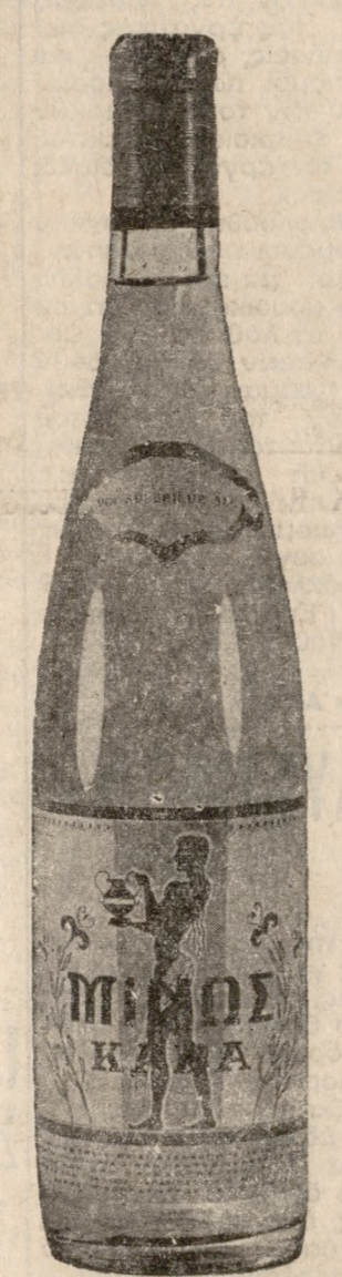
ΚΑΒΑ "ΜΙΝΩΣ" Άνωτάτος κλάσσης καλή και καμπί.

ΜΕΤΑΛΛΙΚΑ ΡΑΦΙΑ Κομφά μεγάλης άντοχής Διά κάθε χρῆσιν Καταστήματα, Ζαχαροπλαστεία κ.λ.π. Άντιπρόσωπος ΕΥΑΓΓΕΛΟΣ ΧΡΗΣΤΑΚΟΣ Δαιδάλου - Τηλ. 78.37 - 66.84 ΠΩΛΗΣΙΣ ΧΟΝΔΡΙΚΗ Άτροπλοία Κ. ΕΥΘΥΜΙΑΔΗ ΤΑ ΦΕΡΥ-ΜΠΩΤ "ΜΙΝΩΣ,, & "ΣΟΦΙΑ,, ΤΑ ΔΥΟ ΜΕΓΑΛΥΤΕΡΑ ΦΕΡΥ-ΜΠΩΤ ΤΟΥ ΚΟΣΜΟΥ Έξασφαλιζόν καθημερινάς άναχωρήσεις από Ηράκλειον προς Πειραιά και έκ Πειραιώς δια Ηράκλειον. Άναχωρήσεις τής τρεχούσης εβδομάδος: Τετάρτη 6,30 μ.μ. Πέμπτην 6,30 μ.μ. Παρασκευή 6,30 μ.μ. Σάββατο 6,30 μ.μ. και Κυριακή 6,30 μ.μ. Κεντρικά πρακτ. 25ης Αύγ. Έναντι Άγ. Τίτου Τηλ. 64.50 και 65.50 " " Έβανς" 37.77 " 63.88 " 25ης Αύγ. Μ. Θεοδοσάκη 27.06 Χανίων Πόρτα Μανουράς τηλ. 2'46