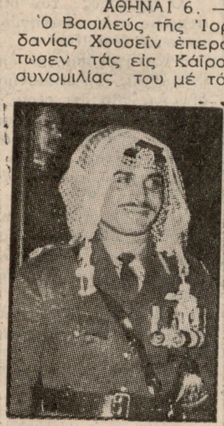
Ο ΒΑΣΙΛΕΥΣ ΧΟΥΣΕΪΝ πρόεδρος Νάσερ.

ΑΘΗΝΑΙ 6. — Ο Βασιλεύς της 'Ιορδανίας Χουσεϊν επεράτωσεν τας εις Κάϊρον συνομιλίας του με τον έπίτευξιν δικαίας και νόμου ειρήνης εις την Μέσην 'Ανατολήν βάσει του ψήφισματος του συμβουλίου ασφαλείας των 'Ηνωμένων 'Εθνών το όποιον ένεκρίθη τον Νοέμβριον του 1967.