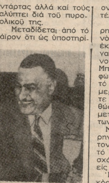
Ο ΠΡΟΕΔΡΟΣ ΝΑΣΕΡ

ΑΘΗΝΑΙ 6. — Ο Βασιλεύς της 'Ιορδανίας Χουσεϊν επεράτωσεν τας εις Κάϊρον συνομιλίας του με τον έπίτευξιν δικαίας και νόμου ειρήνης εις την Μέσην 'Ανατολήν βάσει του ψήφισματος του συμβουλίου ασφαλείας των 'Ηνωμένων 'Εθνών το όποιον ένεκρίθη τον Νοέμβριον του 1967.