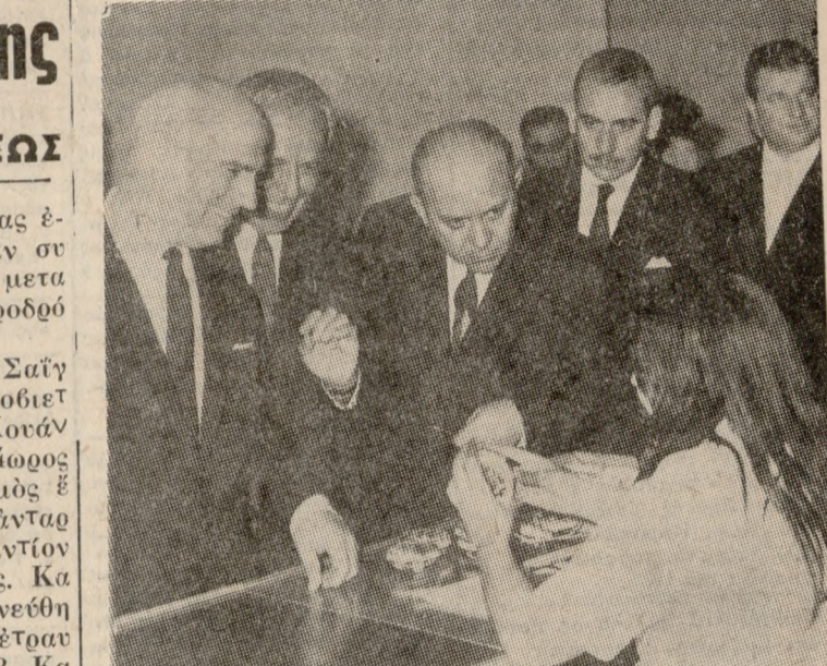
Επί τήν τελετήν άναίτησιν της 'Ελλάδος, έρχεται δε ως συνέχεια ενός συνθέτου διηκούς ύπέρ της δύο γενεάς. Καί άσφαλώς, δύναται να είπω, ή ίδια μονάς δέν είναι παρά εις κρίκος εις τήν άλυσίδα των 'Ελληνογερμανικών οικονομικών, τεχνικών και έμπορικων σχέσεων, ή όποία δά έχη μακράν συνέχισιν, έπ' όφέλειά ού μόνον των δύο οικονομιών, αλλά και θαύτοτρον αυτών των φιλικών σχέσεων, οι όποια σή

ΝΕΑ ΜΟΝΑΣ ΤΗΣ 'ΣΗΜΕΝΣ,, ΕΝΕΚΑΙΝΙΑΣΘΗ ΕΙΣ ΘΕΣΣΑΛΟΝΙΚΗΝ Συμβολή εις τήν 'Ανάπτυξιν τής Χώρας. 'Όπως έτόνισεν και ό 'Αντιπρόεδρος της 'Εθνικής Κυβερνήσεως κ. Στ. Παττακός ή ένκαινισθείσα προχέει εις Θεσσαλονίκην μονάς της Σήμενς άποτελεί μίαν περαιτέρω συμβολήν του Οίκου Σήμενς εις τήν τεχνικήν και βιομηχανικήν ανάπτυξιν της 'Ελλάδος, έρχεται δε ως συνέχεια ενός συνθέτου διηκούς ύπέρ της δύο γενεάς. Καί άσφαλώς, δύναται να είπω, ή ίδια μονάς δέν είναι παρά εις κρίκος εις τήν άλυσίδα των 'Ελληνογερμανικών οικονομικών, τεχνικών και έμπορικων σχέσεων, ή όποία δά έχη μακράν συνέχισιν, έπ' όφέλειά ού μόνον των δύο οικονομιών, αλλά και θαύτοτρον αυτών των φιλικών σχέσεων, οι όποια σή